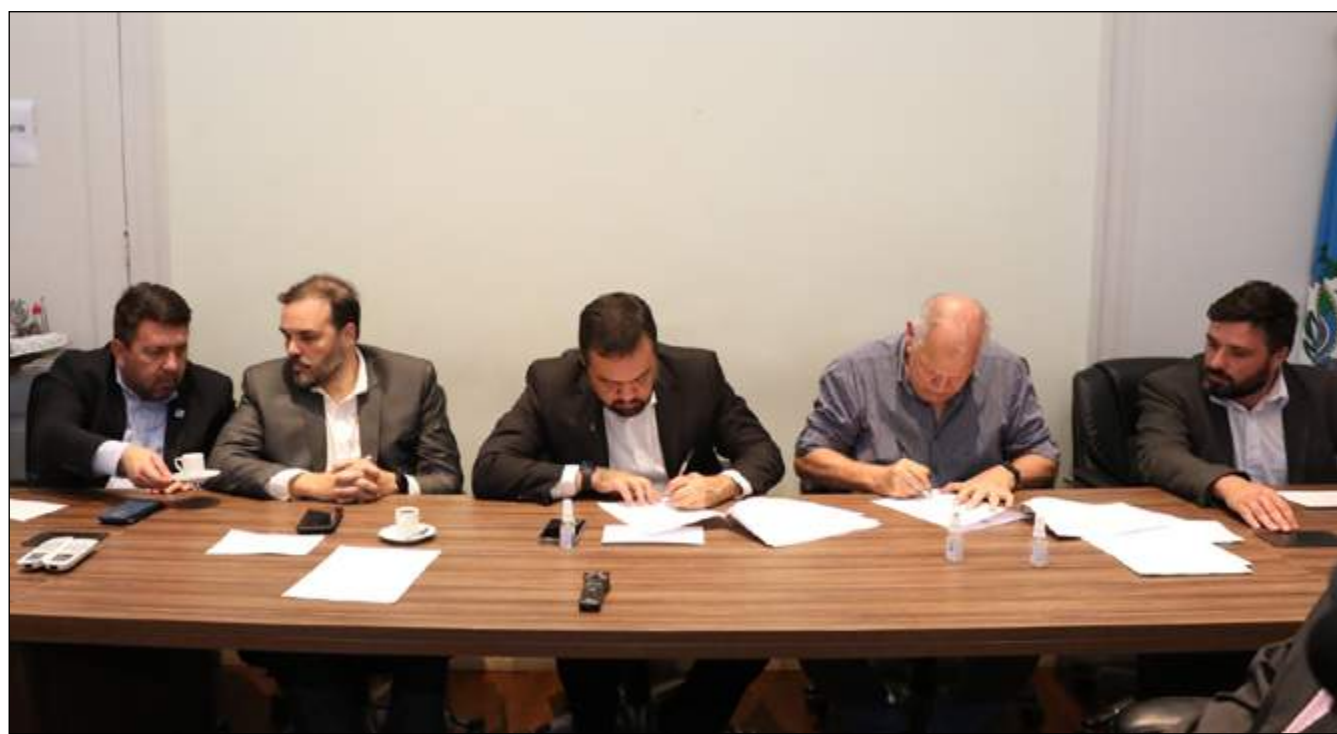
COM A assinatura do termo fica definido que o Estado irá repassar ao município os recursos para pagar benefício

O modelo para pagamento do benefício de forma conjunta foi definido em reunião na quinta-feira no Palácio Guanabara. “O prefeito fez uma colocação muito pertinente, de que é muito difícil que o locador tenha segurança quando o pagamento é feito por dois entes diferentes. Definimos então pela unificação