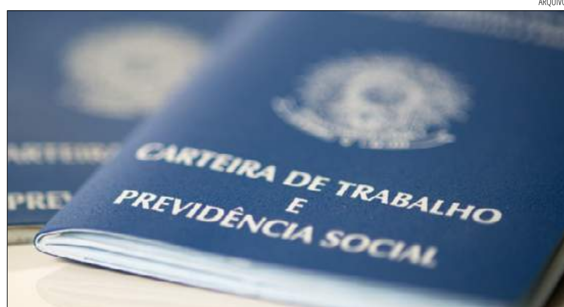
O SETOR que mais teve impacto foi o comércio, que teve 224 vagas cortadas só no último mês