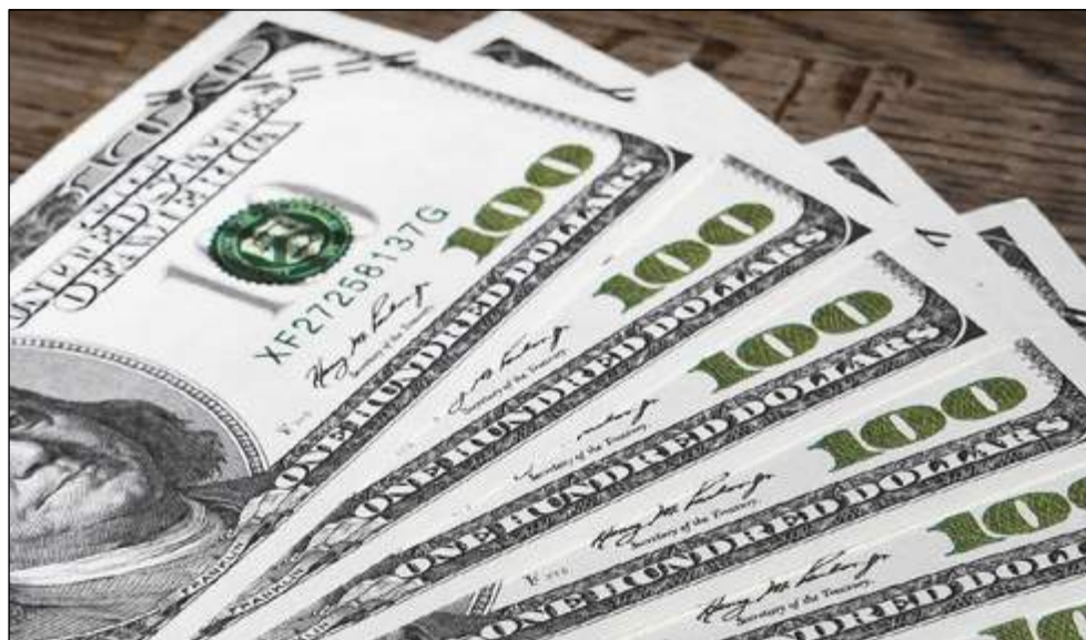
AS CONTAS do setor de serviços registraram déficit de US$ 1,8 bilhão em fevereiro