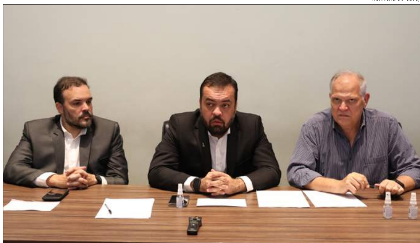
ALÉM DA assinatura do termo de unificação do Aluguel Social, Cláudio Castro também vistoriou as obras realizadas pelo Estado

Em visita a Petrópolis, o governador Cláudio Castro e o prefeito Rubens Bomtempo assinaram um termo de cooperação para unificar o pagamento do Aluguel Social para as vítimas das tragédias de 15 de fevereiro e 20 de março. O benefício no valor de R$ 1 mil foi anunciado em fevereiro. São R$ 800, custeados pelo Estado e R$ 200, pela prefeitura. A partir do acordo firmado nesta sexta-feira (29), a parte custeada pelo Estado será repassada ao Município, que fica responsável pelo pagamen-