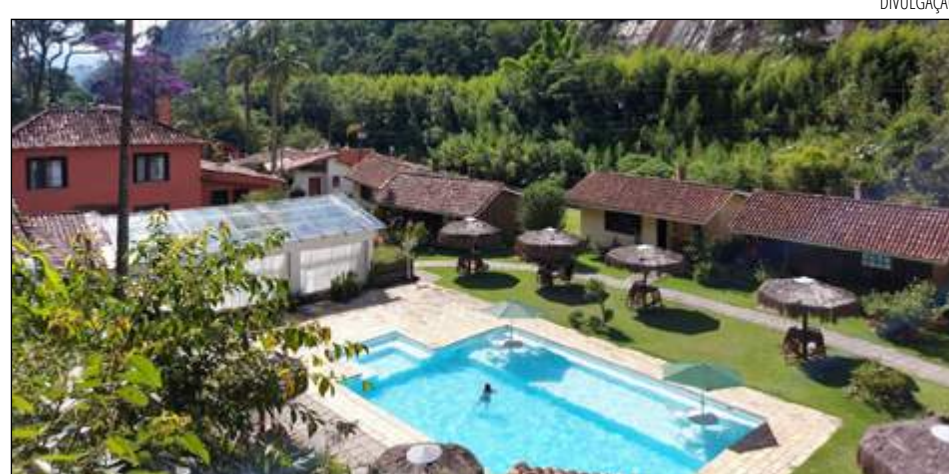
PETRÓPOLIS comporta uma série de opções para qualquer estilo e idade nesta data