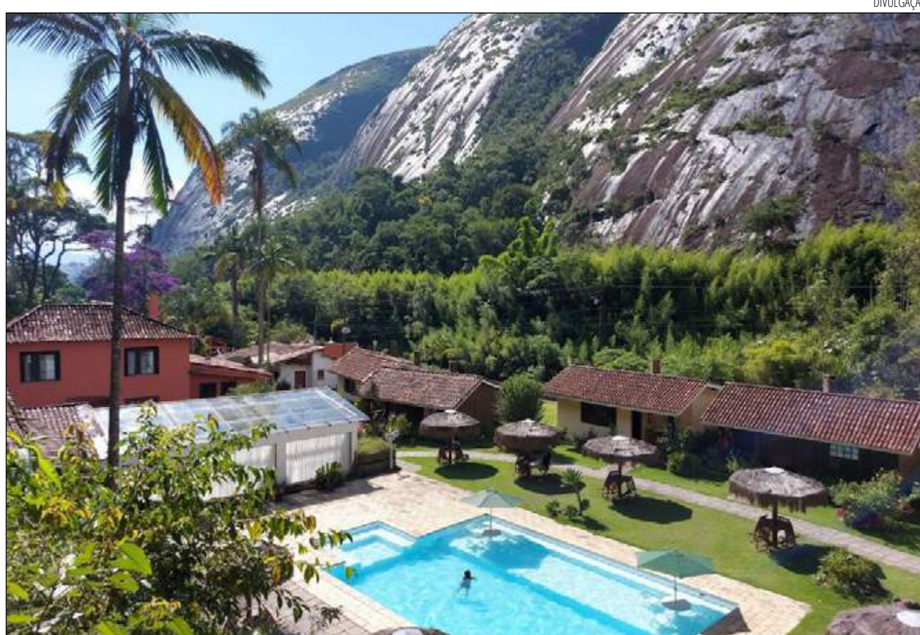
MUNICÍPIO oferece pacotes em hospedagens, passeios com roteiros especiais, sobremesas de brinde para mães e filhos

“Depois deste período longo de pandemia todas as datas ficam ainda mais especiais. É extravasar a vontade de celebrar que estava presa por dois anos. Então estamos vivenciando uma rede hoteleira com reservas em alta e restaurantes cheios. Cada um dos hotéis, pousadas e restaurantes tem alguma promoção.