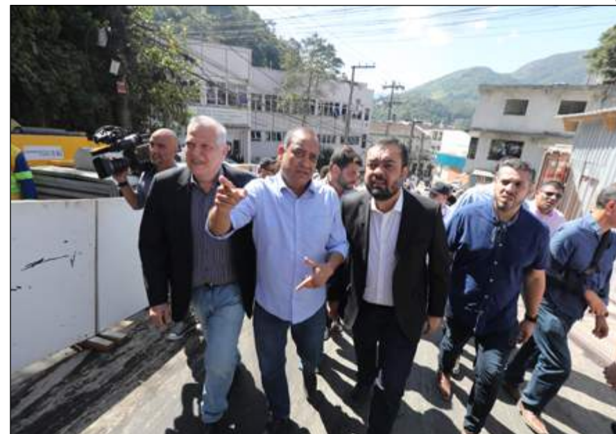
CASTRO e comitiva visitaram locais com intervenções do Governo do Estado

Cláudio Castro esteve na área onde estão sendo feitas intervenções para estabilização de