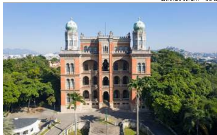
ESTUDO defende planejamentos de curto, médio e longo prazos